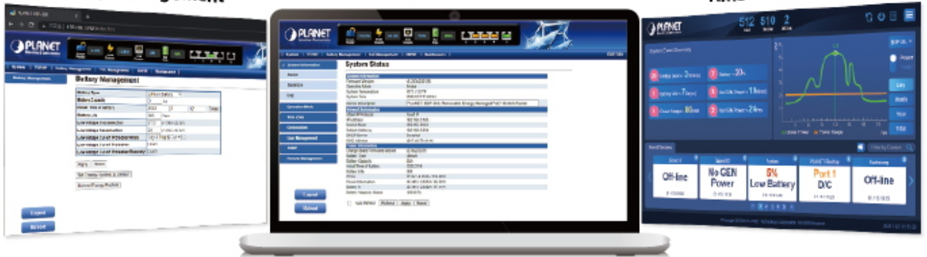
NMS-360 Web GUI