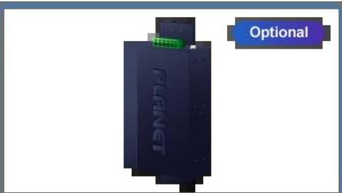
Side Wall Mounting (Space saving)